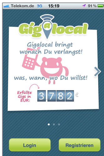
Abb. 1: Startseite der App