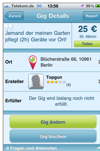
Abb. 4: Gig-Details anzeigen lassen