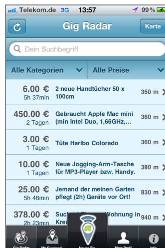
Abb. 6: Listenansicht aktiver Gigs