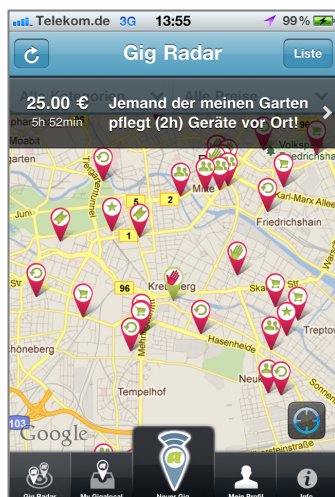
Abb. 5: Übersicht aktiver Gigs auf Karte