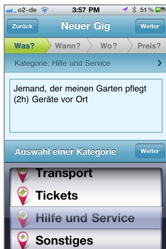
Abb. 3: Gig einstellen